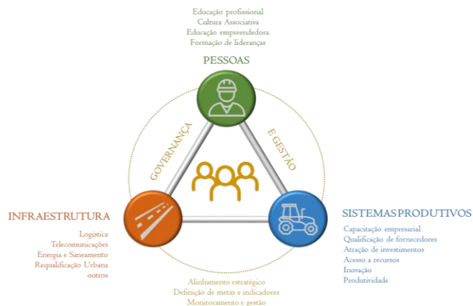
Figura 02 – Eixos prioritários.